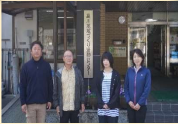
よろしくお願いします

令和5年度が始まり、高川公民館から高川地域づくり活動センターに移行され、行政相談窓口や各種手続等の機能が拡充となり、慌ただしく業務を行っております。手続きに戸惑うことも多く、また、夜間・休日のセンターの利用方法が大きく変わり、住民の皆さまにはご迷惑をおかけしております。 住民の皆さまが利用しやすく気軽に立ち寄れるセンターになるように取り組んで参りますので、引き続きご指導ご協力をお願いいたします。