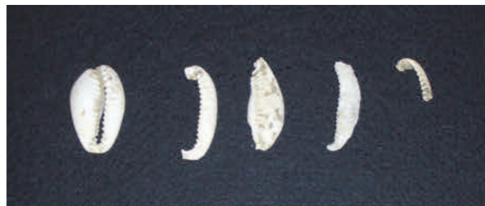
写真 4 タカラ貝製のアクセサリー