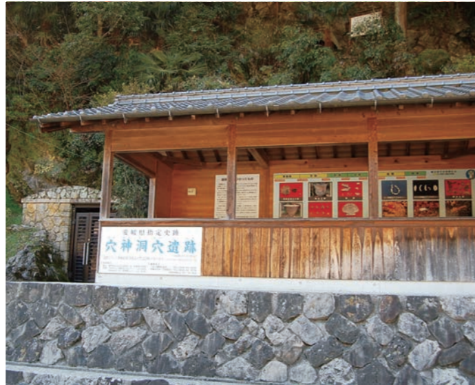
写真 1 穴神洞穴遺跡

また、貝でできた装飾品（アクセサリー）も見つかっていて、その多くが海岸部で採集されたと考えられています。ツノガイの装飾品が出土した埋葬遺構や骨角器、動物の骨なども見つかっています。