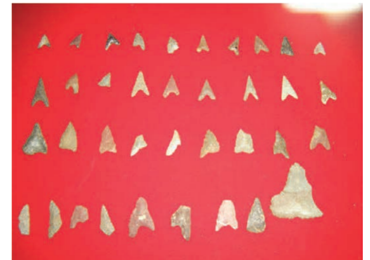
写真 7 石の鏃（やじり）