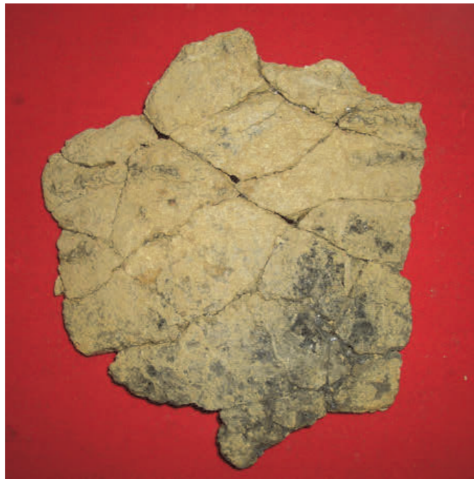
写真 2 微隆起線文土器