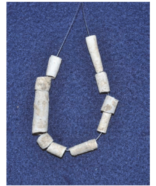
写真 5 ツノ貝製のアクセサリー