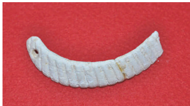
写真 3 サトウ貝製のアクセサリー