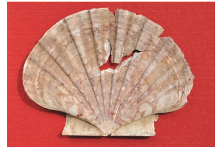
写真 6 イタヤ貝