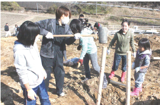
← 過去の植樹の様子