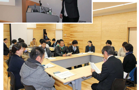
→ 12月にまなびあんに総会