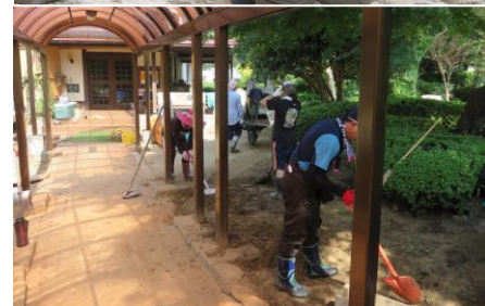
←流れ込んだ土砂を除去しきれいになったロッジ玄関前

SUIJI来てます! 今年も愛媛大学から15人の学生が高川地区内でさまざまな活動を行い、皆さんと交流を深めていることと思いますが、その集大成である成果報告会を行います。ぜひご覧になってください。 SUIJI 成果報告会 日時…8月28日(火)午後7時から 場所…高川公民館