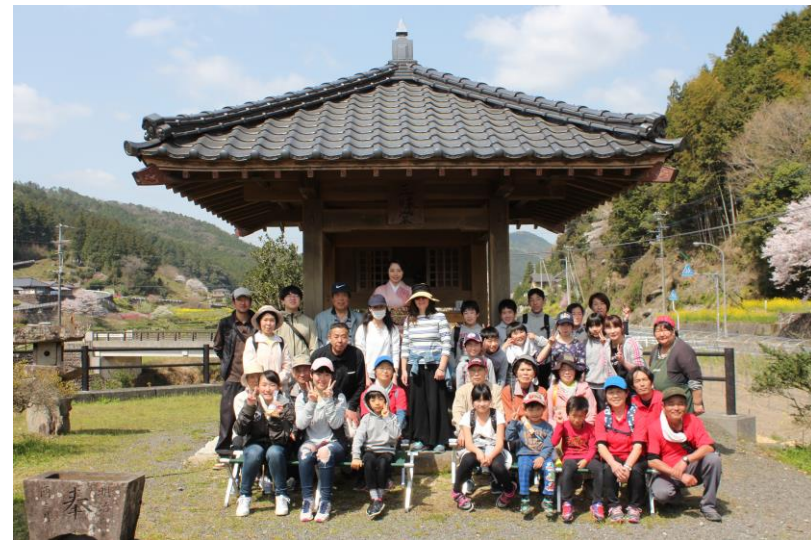
↑参加者と満開となった桃と桜の花 ←休憩所となった池野々茶堂

3月31日(土)に、フットパスのイベントが開催されました。今回のイベントは、地域づくり会が進めている『桃源郷の里づくり』とのコラボレーションとなり、桃や桜の花が咲く高川公民館下河川遊歩道や高野井公園を巡る桃源郷コース。 当日は天候にも恵まれ、30数人の参加者が約2時間半をかけ、咲き誇る桃や桜を眺めながら歩きました。 また、休憩所として池野々茶堂では「茶堂カフェ」がオープン、お茶や揚げパンをご用意いただき、春の高川を満喫しました。